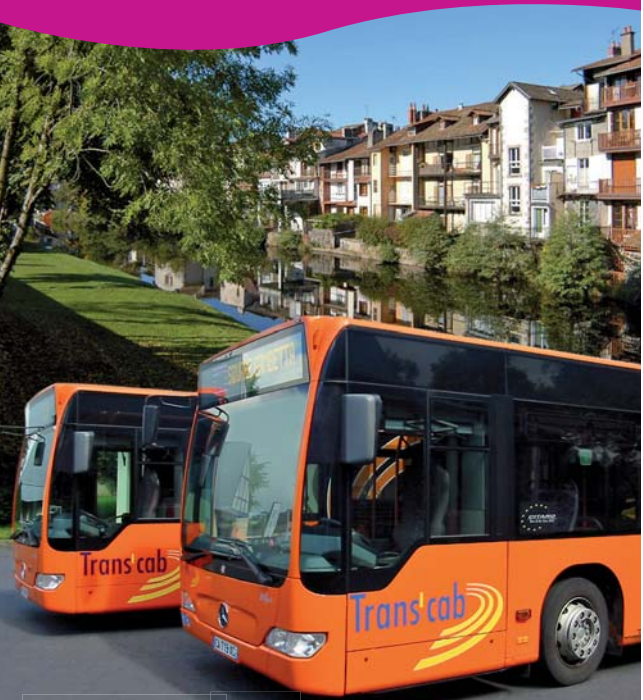
Réseau exploité par Stabus